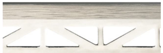
pro-part line matt