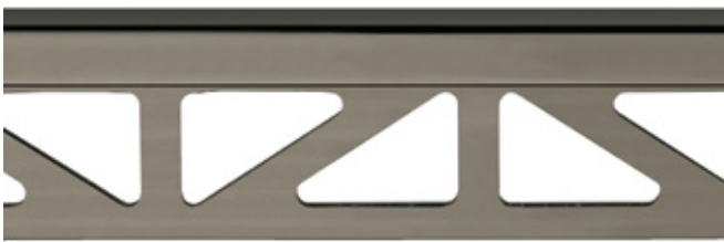
pro-part graphite matt