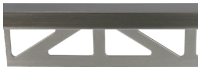
pro-part old iron