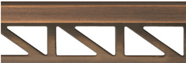
pro-part old bronze