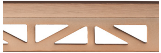
pro-part rose line