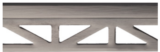
pro-part graphite matt line