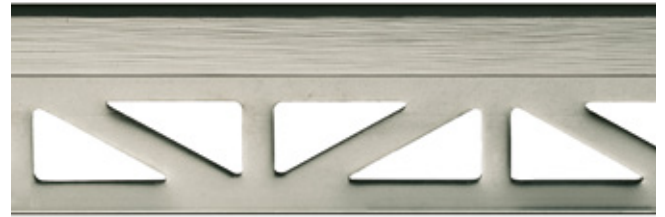
pro-part moon line