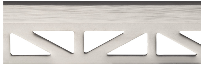
pro-part moon line