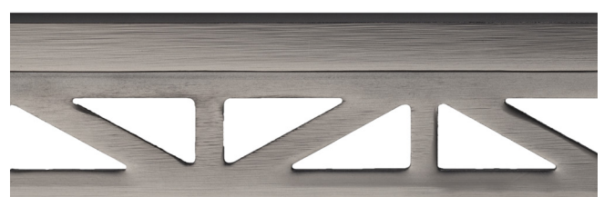
pro-part graphite matt line