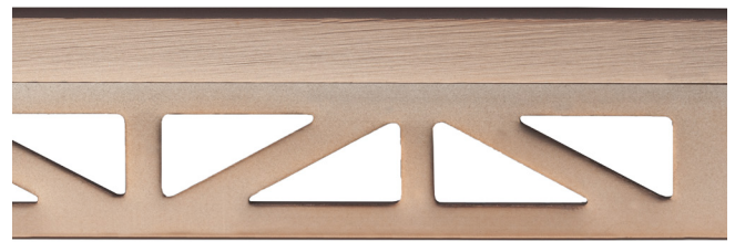
pro-part rose line