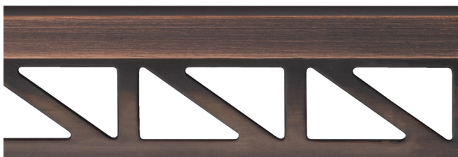
pro-part old bronze