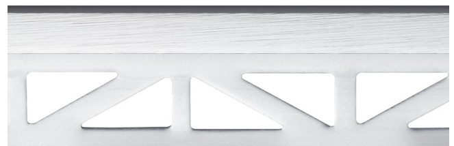
pro-part ocean line