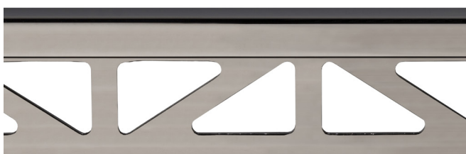
pro-part graphite matt