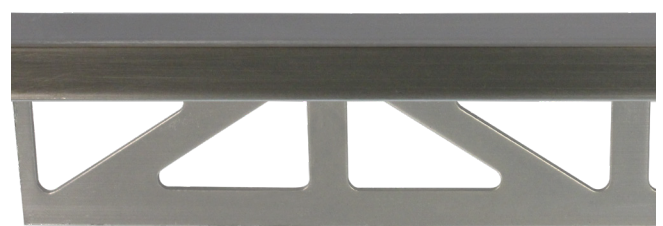
pro-part old iron