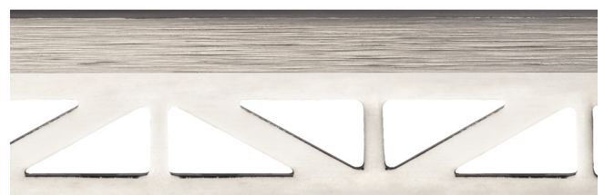
pro-part line matt