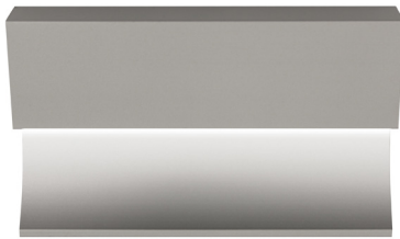
pro-skirting led anodized