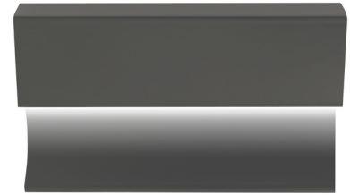
pro-skirting led black