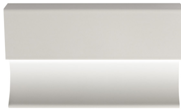
pro-skirting led white